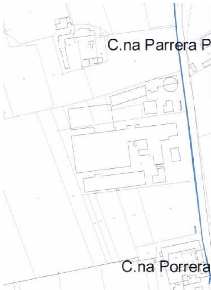
Figura 1 – estratto catastale delle aree in variante (non in scala)